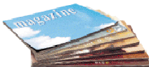
MAGAZINES-ANNUAIRES CATALOGUES - ENVELOPPES EN PAPIER