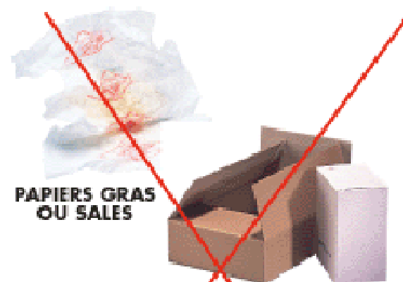
PAPIERS GRAS OU SALES